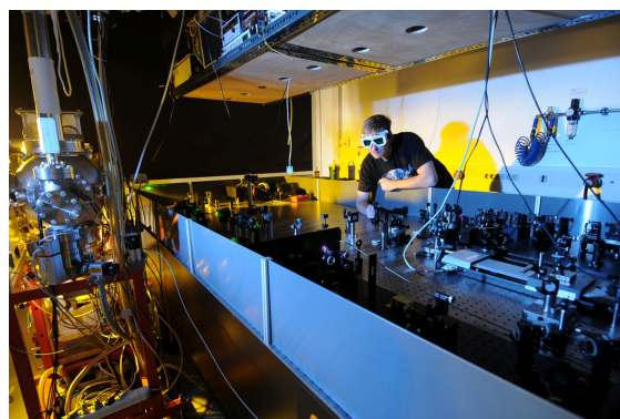
Der Pump-Probe-Aufbau zur Detektion ultraschneller Prozesse in Molekülen

Für die Photoelektronenspektroskopie (PES) wurde ein Setup konzipiert, der zwei Lichtpulse einer Pulsdauer von wenigen Femtosekunden bei 2 kHz Repetitionsrate erzeugt. Der Pump-Puls ist von 200 bis 400 nm abstimbar und versetzt das Molekül in den angeregten Zustand. Der zeitlich zum ersten variierbare Probe-Puls um 220 nm ionisiert das Molekül. Da das Molekül nach der Anregung durch Konversion oder Relaxation die eingebrachte Energie umverteilt, ändert sich auch die Überschussenergie des Elektrons nach der Ionisation. Durch Ändern des zeitlichen Delays zwischen den Lichtpulsen kann somit die Dynamik des Moleküls aufgezeichnet werden.